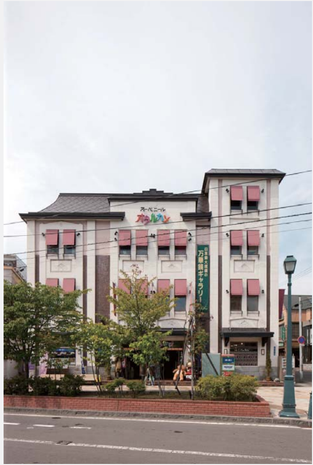
所在地／小樽市入船 1 丁目 1-1 建築年／大正 15 年（1926） 構 造／木造一部煉瓦造 3 階建

かつてこの場所は入船川の河口があり（昭和初期に暗渠化）、船入澗（斛による荷物の積み下ろし場）が置かれた入船七差路に建物は面している。もとは富山県に本店を置く、衣料呉服の支店として建てられた。隣の中越銀行小樽支店とは対照的に、外観の縦線が印象的な建物である。この奥には煉瓦造 3 階建ての倉庫が続く。倉庫内部は 1 階の鉄製円柱の頂部に肘木を乗せ、2 階の床を支える。