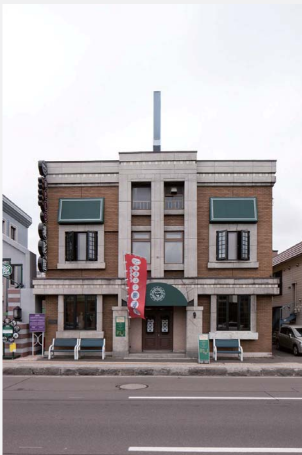
所在地／小樽市色内 1 丁目 2-17 建築年／昭和 10 年（1935） 構 造／木造 2 階建

海産業を商い、後に海運業にまで成長した、荒田太吉商店の本店事務所。運河沿いの小樽臨港線に面して建つ。左右対称の外観をした事務所らしい建築で、改修されているものの、内壁の漆喰や照明器具、窓枠は創建時の様子を今に伝える。背面の高橋倉庫や左隣の旧通信電設浜ビルなどと中庭で結ばれ、歴史的な景観のまとまりを生み出している。